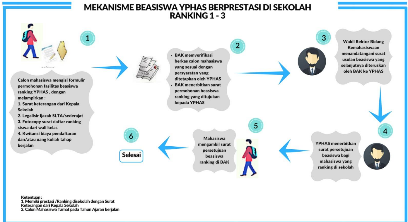
Mekanisme Beasiswa YPHAS Berprestasi Di Sekolah Ranking 1-3